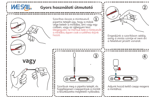
Quick User Guide(20 tests/kit)

Figyelem: Használat előtt tartsa a WESAIL COVID-19 Semlegesítő Antitest tesztkészlet kazettáját a fóliatásakban. A kazettát a fóliatásak kinyitása után 30 percen belül fel kell használni. Ha a hőmérséklet magasabb, mint 30°C, vagy magas a helyiség páratartalma, akkor a fóliatásak kinyitása után azonnal fel kell használni.